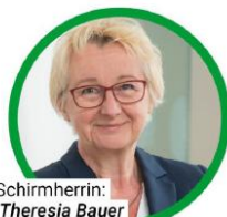
Schirmherrin: Theresia Bauer Baden-Württemberg-Stiftung

Was wächst, blüht, krabbelt und fliegt auf unserer Blumenwiese, wir bestimmen die Pflanzen und erweitern unser Wildbienenhotel.